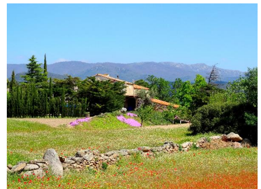
le mas Baleta