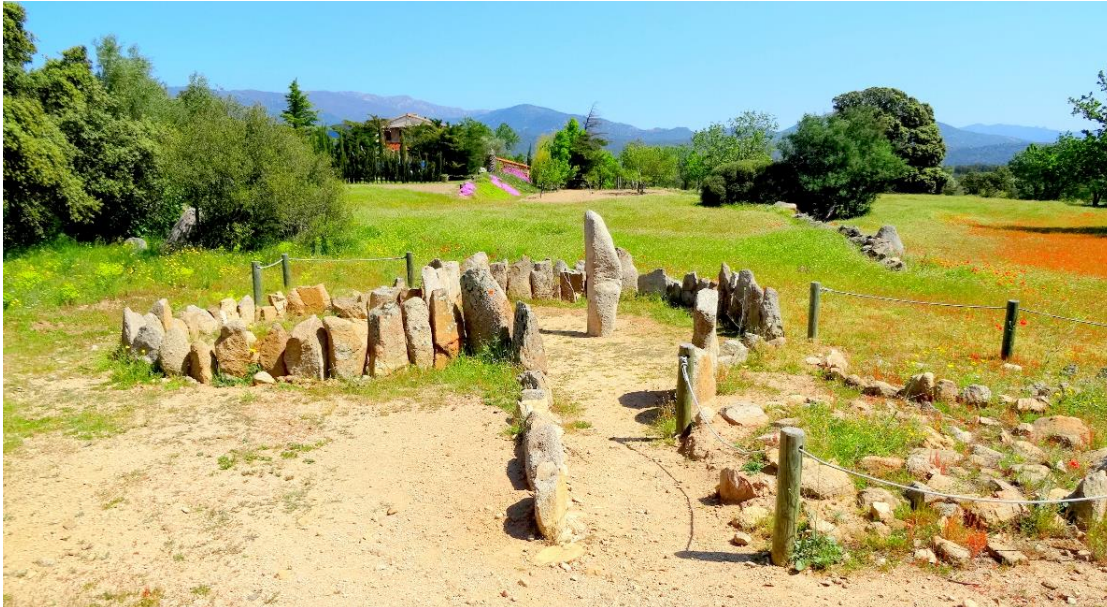
l'enceinte mégalithique : cromlech du mas Baleta :

Les monuments mégalithiques n'en sont pas pour autant de simples contenants. Ils ont une valeur symbolique et monumentale et une destination religieuse. Ils traduisent l'attachement du groupe social au territoire occupé, son souci de permanence et ils assurent la communication entre le monde des vivants et celui des morts